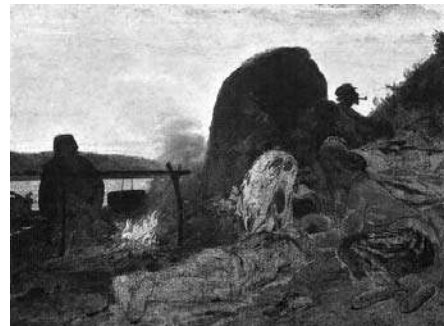
«Бурлаки у костра» Рис. 3

Протекание химической реакции изображено на рисунке: