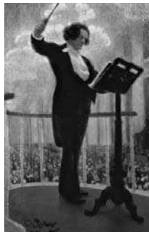
«Портрет А.Г. Рубинштейна» Рис. 1

2.1. Из представленных ниже репродукций картин выдающегося русского художника И.Е. Репина (1844 – 1930) выберите ту, на которой изображено протекание химической реакции.