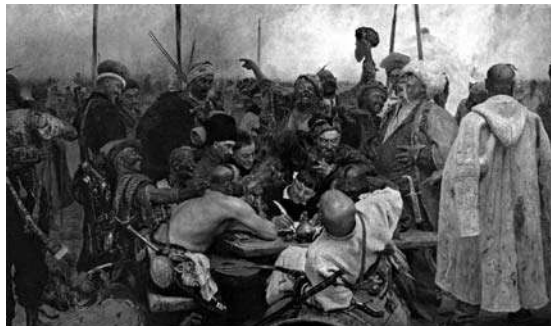
«Запорожцы пишут письмо турецкому султану» Рис. 2