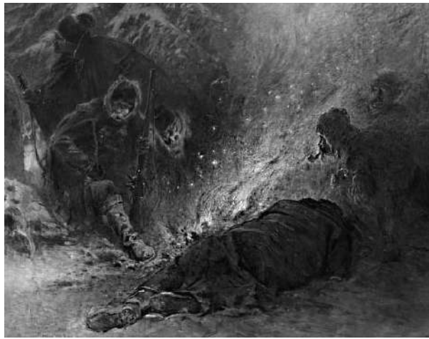
«Иван Сусанин» (фрагмент) Рис. 2