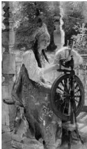
«За прялкой» Рис. 1

2.1. Из представленных ниже репродукций картин выдающегося русского художника К.Е. Маковского (1839 – 1915) выберите ту, на которой изображено протекание химической реакции.