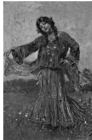
«Цыганка танцует» Рис. 3

Протекание химической реакции изображено на рисунке: